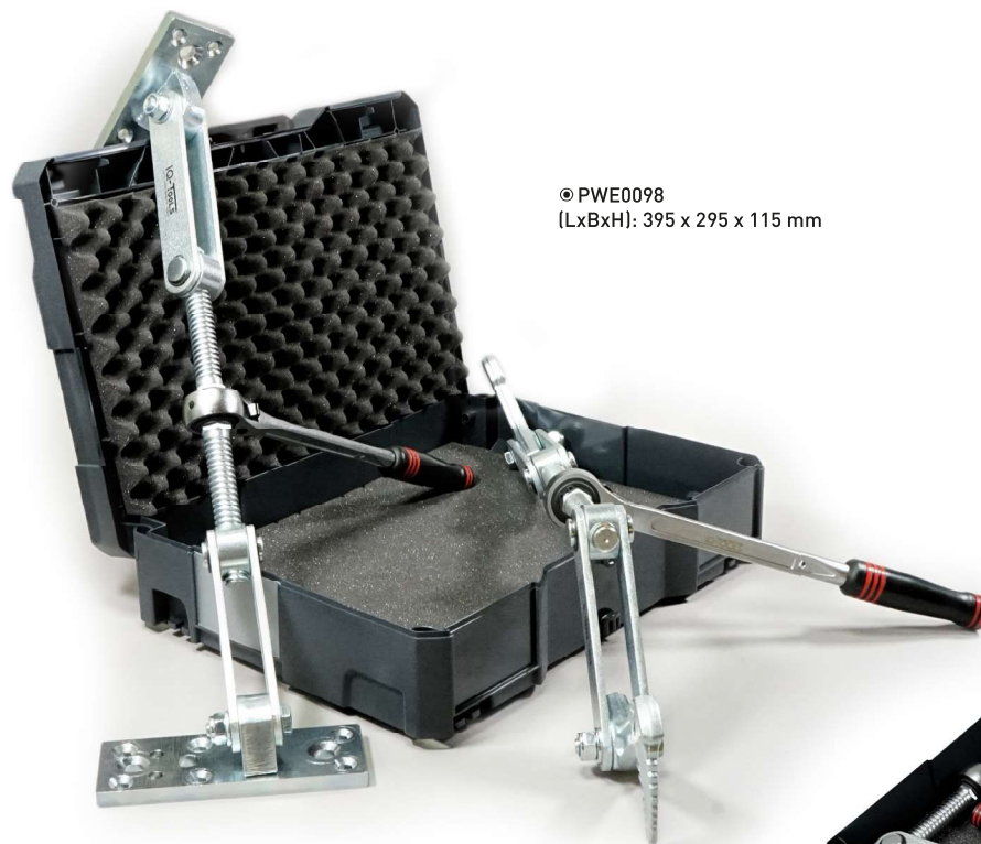
© PWE0098 (LxBxH): 395 x 295 x 115 mm

UNVERZICHT- BAR FÜR DEN MODERNEN HOLZBAU